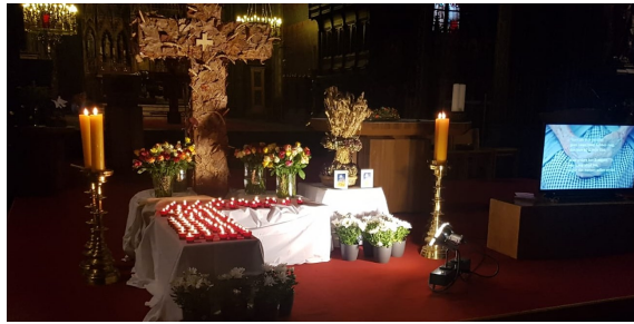
foto van Nightfever - Allerheiligen 2023